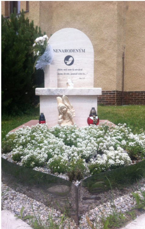
Pamätník pri dome smútku v Spišskej Belej

Už dlhší čas sme v Spišskej Belej túžili mať pamätník nenarodeným deťom na našom cintoríne. V júni minulého roku sme začali túto túžbu postupne uskutočňovať – najprv sme podali žiadosť na mestské zastupiteľstvo. Napokon sme dostali povolenie na vybudovanie pamätníka. Dňa 13. mája 2014, presne na deň fatimských zjavení, boli práce ukončené. A tak nám nič nestálo v ceste, aby sme mohli slávnostne odhaliť a posvätiť pamätník za nenarodené deti. Toto sa uskutočnilo dňa 8. júna 2014 na miestnom cintoríne v Spišskej Belej.