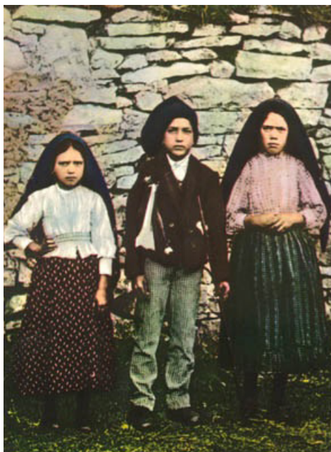
Hyacinta František Lucia

Keď sa zjavenie skončilo a deti prišli domov, Lucia mala z toho veľké problémy. Jej mama nechce prijať takúto správu, aby jej dcéra mala nejaké videnie, má z toho hrôzu, strach. Lucia pre tieto zjavenia veľmi trpí.