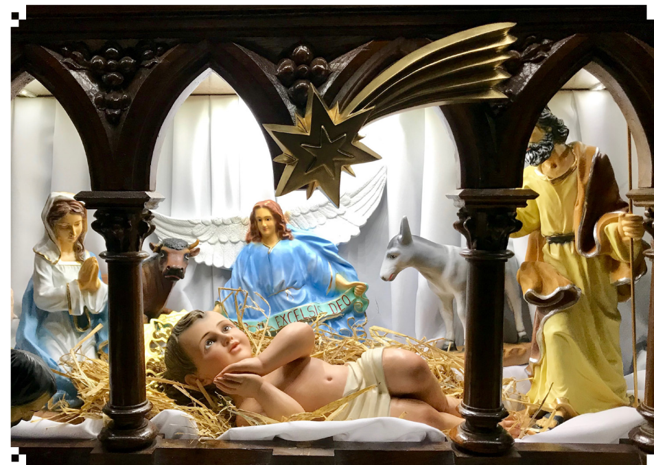
Jasličky z farského kostola v Spišskej Belej.

N ech vám naplní srdce hlboký pokoj a nekonečná dôvera v Toho, ktorý sa narodil nespoznávaný v tichu noci v biede a prešiel všetkým ťažkosťami a utrpením, aby sa stal oporou pre každého z nás a prameňom šťastia a oslobodenia od každého zla.