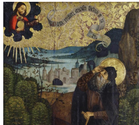
Časť z pôvodného oltára sv. Antona v Spišskej Belej, ktorý je uložený v Budapešťanskom múzeu.

Počiatky belianskej cirkvi, podobne ako aj miestnej komunity, s ktorou bola neoddeliteľne spätá, siahajú ďaleko do obdobia pred prvými písomnými zmienkami. Zásľuhu na šírení kresťanstva mali predovšetkým benediktíni mnísi. Misionári putovali do severných oblastí povodím Váhu, Popradu a Dunajca. Pustovníci šírili kult pre ich rád príznacných a obľúbených svätcov, medzi ktorých patrili aj sv. Anton Pustovník. Práve dodnes nezmenené patrocínium, zasvätenie chrámu v Spišskej Belej svätému Antonovi Pustovníkovi môže poukazovať na túto tradíciu siahajúcu do prvých storočí druhého tisícročia. Kanonicke vizitácie a schematismy katolíckej cirkvi kladú až do 11. storočia aj dátum vzniku Kostola sv. Antona v Spišskej Belej. Podľa týchto prameňov (vychádzajúcich v tomto bode zjavne iba z tradície) kostol bol postavený a tým aj založená fara už v r. 1072, resp. v r. 1092. To by naznačilo súvis epidémiou Erysipel alebo ruža, ktorá prepukla v Európe v 11. storočí, ale rovnako aj s ere-