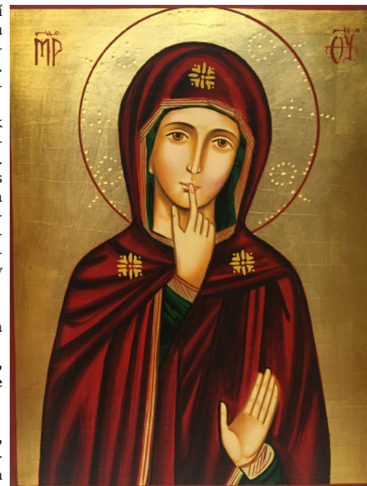
Ikona Panny Márie, Matky Ticha